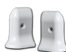
PHTDX - SX 100 Embout plinthe