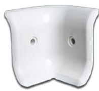
PH3I 100 Angle interieur