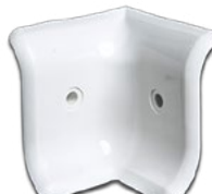
PH2I 100 Angle interieur