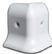
PH2E 100 Angle exterieur